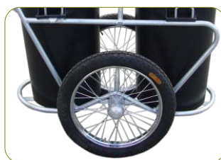
*Cubo da roda em aço vazado