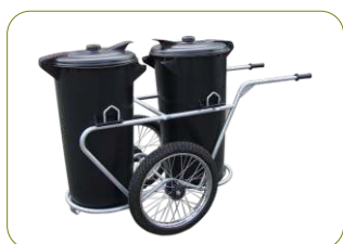
*Cubo da roda em chapa