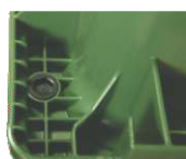
Sistema de redução de ruído