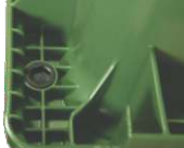
Sistema de redução de ruído