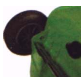
Saída inferior de líquidos