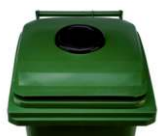
Bocas para recolha selectiva de resíduos