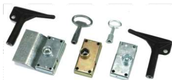
Diversos sistemas de fecho