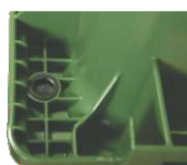
Sistema de redução de ruído